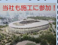
当社も施工に参加！